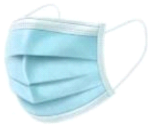
挂耳式医用外科口罩