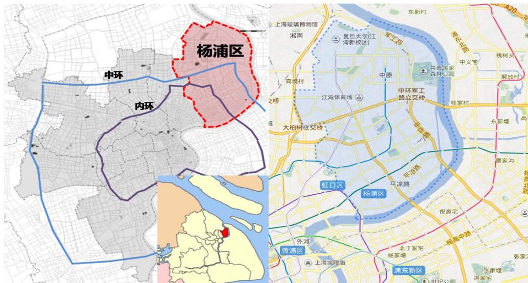
图 1 杨浦区区位图